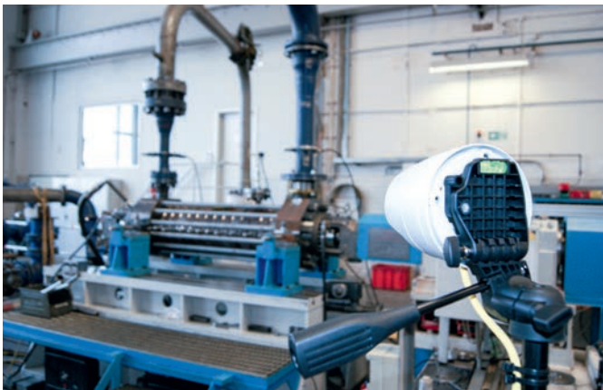
Kamera im Prüffeld zur Liveübertragung des Probelaufes

Alles auf einen Blick, aus der Ferne, aber ganz nah Bislang mussten Sie für die Pumpenabnahme zum Prüffeld in das jeweilige KSB-Werk reisen. Dies ist besonders bei internationalen Projekten zeit- und kostenaufwendig. Mit der Online-Fernabnahme von KSB hat das ein Ende. Diese wurde in der Praxis vielfach erprobt und entsprechend der Abnahmenormen umgesetzt. Ein weltweit eingeführter Qualitätssicherungsprozess, der regelmäßig evaluiert wird, ermöglicht Pumpen-Fernabnahmen nach internationalem Standard.