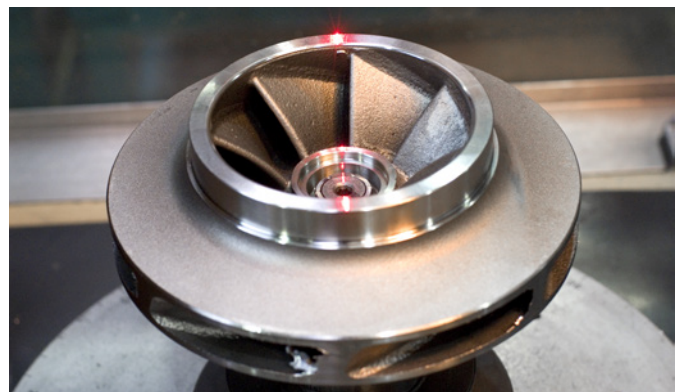
Roue pour pompe RPK reconstruite en Express Line avec le procédé de Reverse Engineering