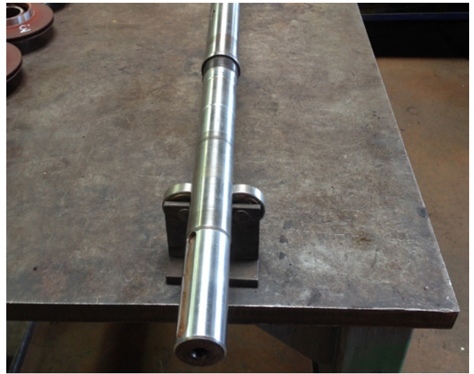
Arbre de pompe HGM usiné en Express Line