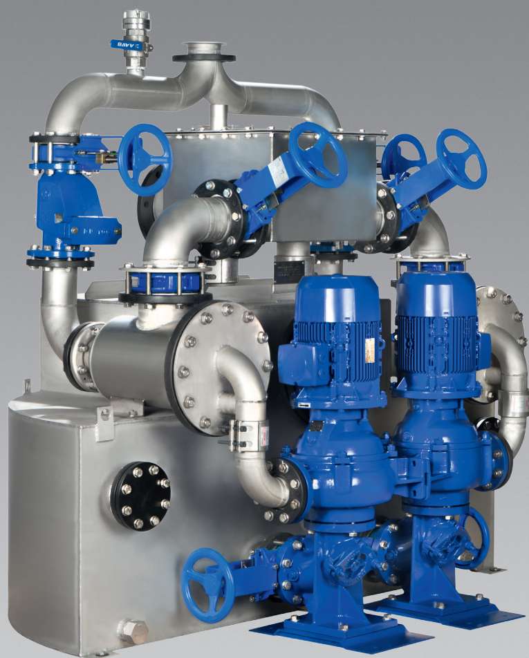
AmaDS 3 – Semicircolare