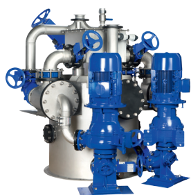
AmaDS 3 – Circolare