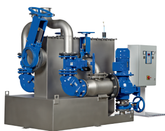
AmaDS 3 – Compatta