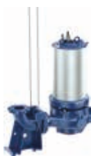
Installazione sommersa con funi di guida