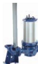
Installazione sommersa con tubi di guida