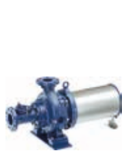
Installazione a secco orizzontale